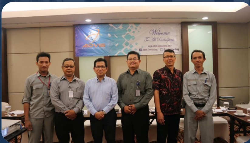
SEMINAR “PENINGKATAN EFISIENSI & PRODUKTIVITAS” bersama PT Barata Indonesia