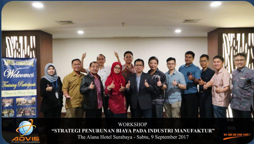
WORKSHOP “STRATEGI PENURUNAN BIAYA PADA INDUSTRI MANUFAKTUR”, The Alana Hotel Surabaya