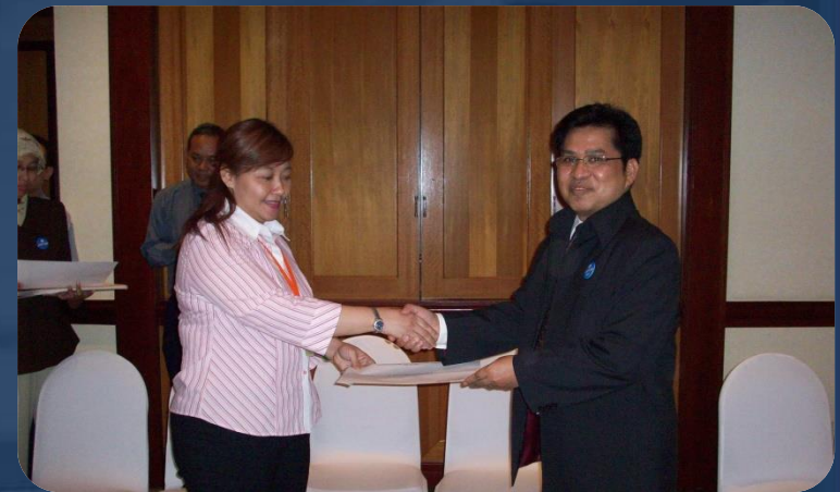
PUBLIC TRAINING BERSAMA DIREKTUR MASPION GROUP