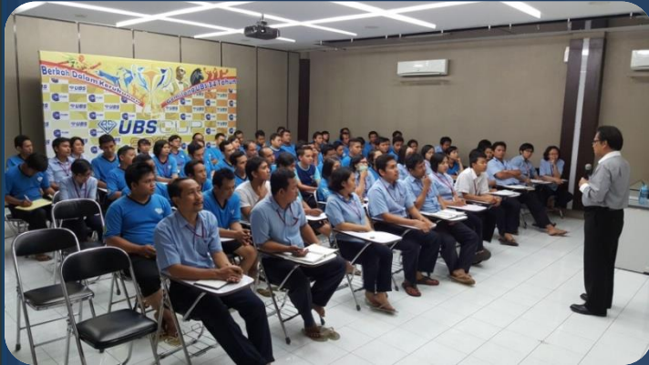
IN HOUSE TRAINING “TRAINING MOTIVASI” di PT Untung Bersama Sejahtera, Surabaya